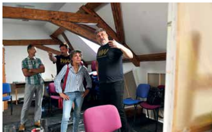
Výtvarný workshop Volary.