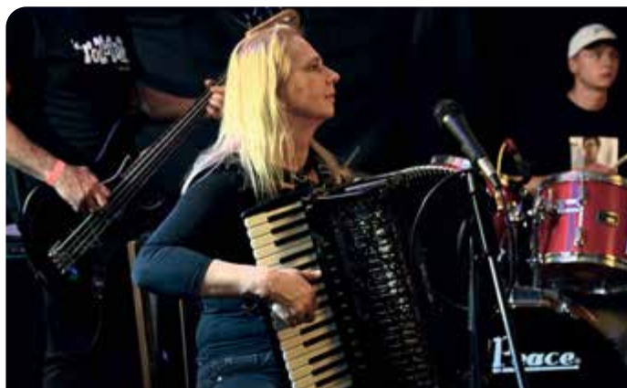
Sen noci svatojánské na Štegrovce.