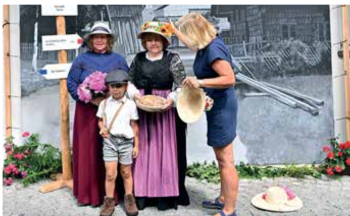
Focení s fotoateliérem Seidel.