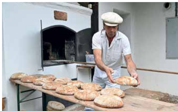
Pečení v muzejní peci.