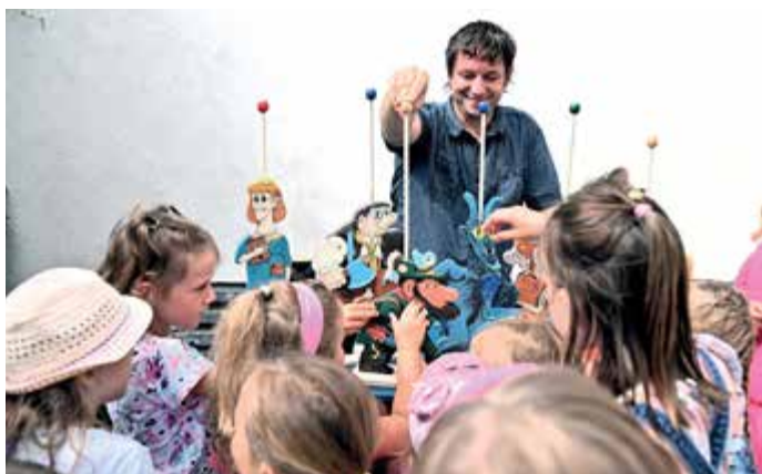
Divadélko v muzeu.