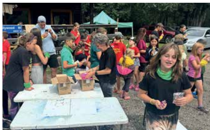
Návštěva dětského tábora v Nové Peci.