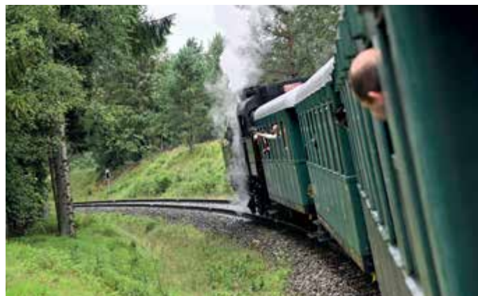
Šumavské léto s párou na Volarsku.