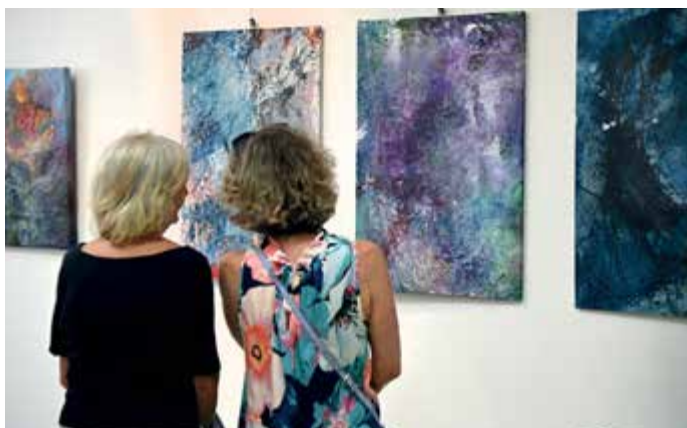
Vernisáž výstavy VWV.