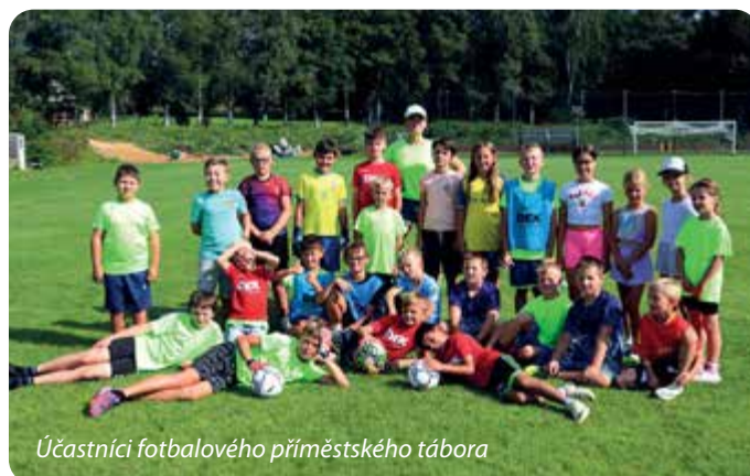
Účastníci fotbalového příměstského tábora